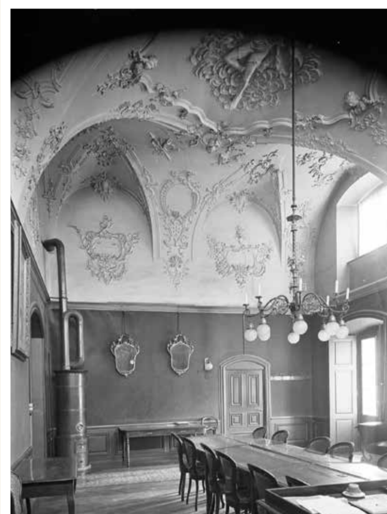
Dal 1807 fin il 1878 è sa radunà qua, en l'anteriura sala da festa da la "Chasa grischina" sut la vopna dals Salis tut da stretg, il Cussegl grond dal Grischun, a la fin cun 71 commembers (fotografia enturn il 1925).

"Nagin auter chantun n'è stà tutgà pli profundamain dad ella [la Constituiziun federala] ch'il Grischun", manegia Peter Metz en ses "Handbuch der Bündner Geschichte". Co vegn Metz a questa constataziun? Igl era evident che la Constituiziun grischuna vertenta dal 1820 n'era betg cumpatibla cun la Constituiziun federala: qua valeva numnadamain la maioritad da las vischnancas giudizialas e betg quella dals burgais. Per ina revisiun da la constituiziun duvravi schizunt ina maioritad da dus terz da las vischnancas giudizialas - in obstachel prest insurmuntabel. Per dar la "garanzia" ad ina Constituiziun chantunala pretendeva la Confederaziun dentant che la maioritad absoluta dals votants stoppia pudair decider davart ina revisiun.