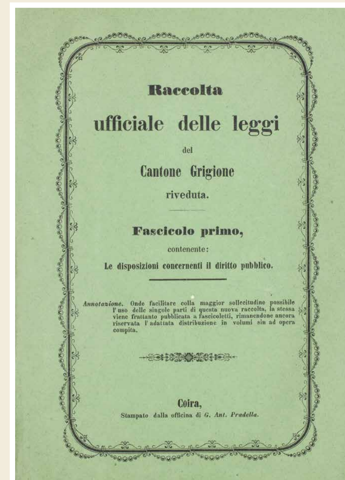
L'emprim tom da la "Raccolta ufficiale delle leggi", cumpari il 1857. El cumenza cun la Constituiziun federala dal 1848 e la Constituiziun chantunala dal 1854. Uschia han las constituiziuns definitivamain chattà la via en il mintgadi politic e giuridic.

restrenschì la pussanza da las vischnancas che funcziunavan sco "pitschens chantuns". Suenter il 1848 èsi stà cler ch'ins stueva prender per mauns insatge. Las tractativas en connex cun la constituiziun grischuna progredivan vinavant mo plaun. Il Grischun ha sinaquai suttemess a l'Assamblea federala l'entschatta dal 1853 ina constituiziun cumplettada mo levamain. E quella è alura vegnida refusada tant dal Cussegl dals chantuns sco era dal Cussegl nazional - ina situaziun ordvart penibla. Ma suenter èsi i svelt: ins ha elavurà il 1853 in nov sboz constituiziunel che las vischnancas giudizialas han approvà gia ils 30 da november 1853. Questa giada ha l'Assamblea federala dà la garanzia ed uschia è il primat da las vischnancas stà surmuntà. La suveranità sa basava ussa sin "la collectivitat dal pievel" (art. 1) e la constituiziun ha pudì vegnir sviluppada vinavant tenor las pretaisas dal temp.